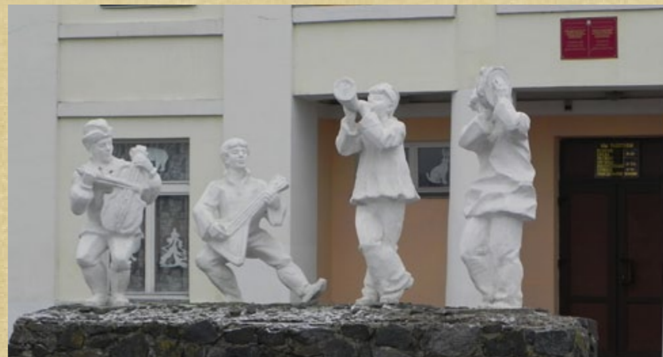
Стояли эти мальчишки много лет перед Туровским Домом культуры неприкаянные, пока не нашёлся добрый человек и не увековечил их уже в слове. И теперь их знают и любят!

него стояли — слева с жаканом, с другого краю — с дробью.